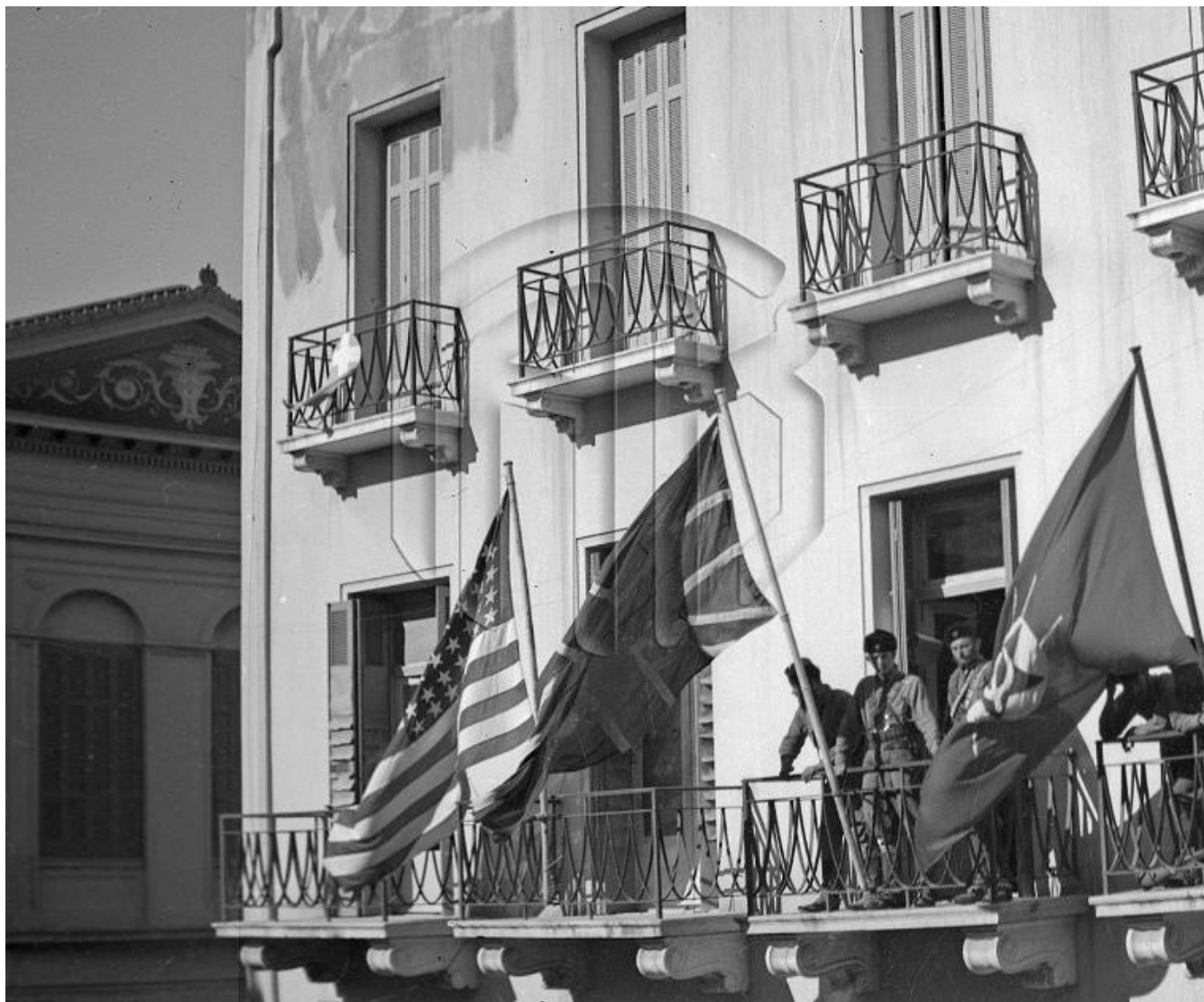
Η ένοπλη συνοδεία του Αρη Βελουχιώτη, γνωστοί ως «Μαυροσκούφηδες», στο ξενοδοχείο «ΡΕΞ» (18-9-1944