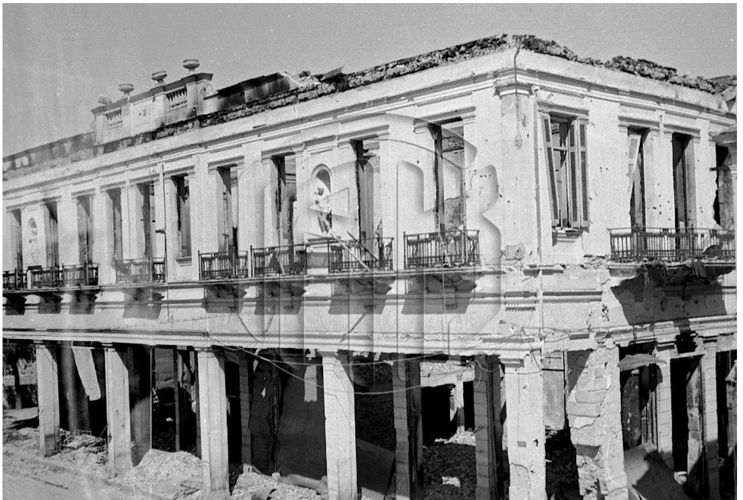
Το κτίριο του Επιμελητηρίου -έδρα της χωροφυλακής επί γερμανικής κατοχής- με εμφανείς τις καταστροφικές ζημιές που υπέστη κατά την είσοδο των ανταρτών στην πόλη (Σεπτέμβριος 1944).