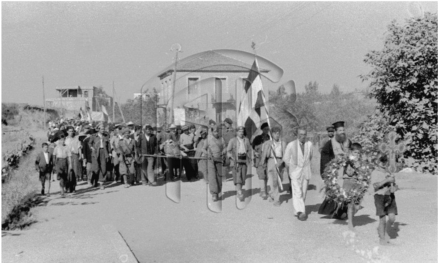
Οδός Μεσσήνης (Αθηνών). Ομαδική είσοδος χωρικών και ένοπλων ανταρτών για τον ενταφιασμό των πεσόντων ανταρτών (10-9-1944)